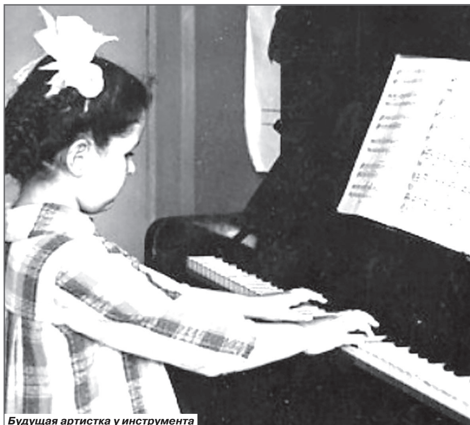
Будущая артистка у инструмента

- Он выполнял еще какие-то поручения маршала?