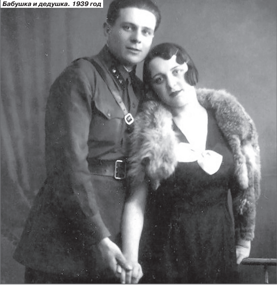
Бабушка и дедушка. 1939 год

очень нравилось создавать что-то новое, однажды я даже сшила шикарное пальто с подкладкой и флисом.