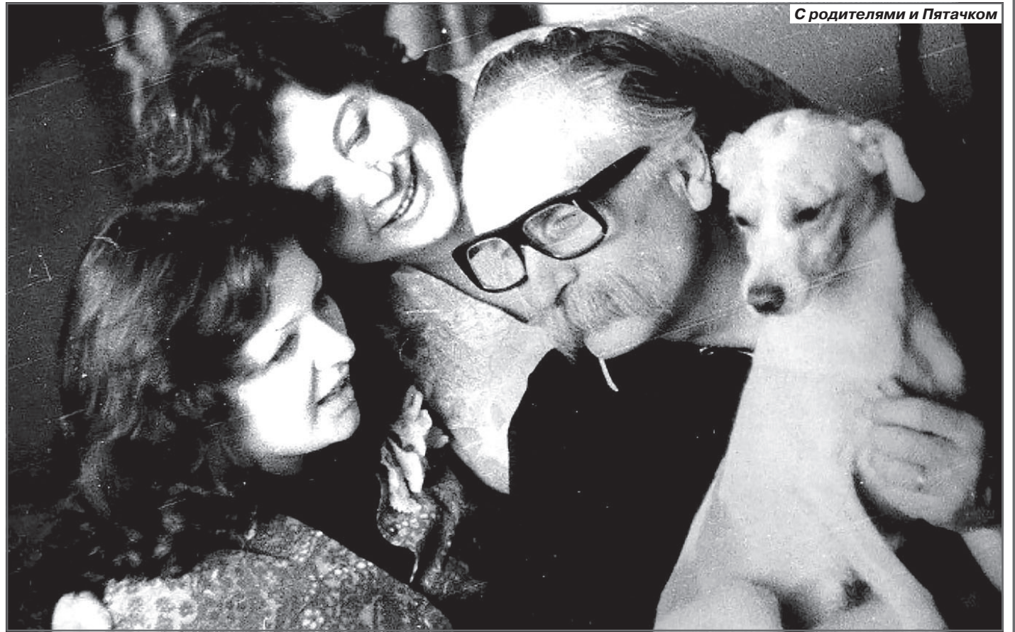
С родителями и Пятачком