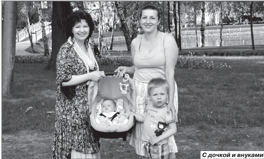
С дочкой и внуками

И хирург сохранил! Правда, нога после операции стала короче на несколько сантиметров, и он какое-то время ходил на костылях. Потом, чтобы вытянуть ногу, он очень много времени проводил у балетного станка, придумал широкую походку, чтобы не была заметна разность ног, сделал себе трость, но позвонки всё равно сместились.