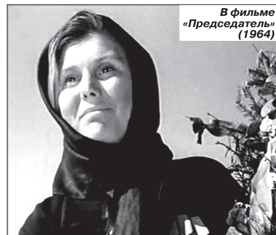
В фильме «Председатель» (1964)