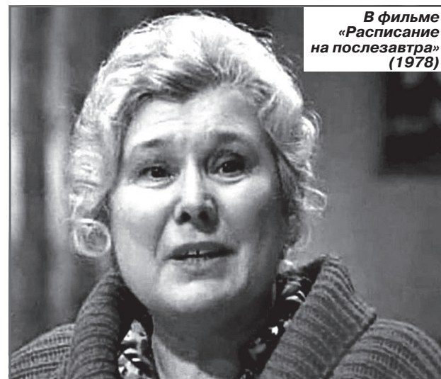
В фильме «Расписание на послезавтра» (1978)