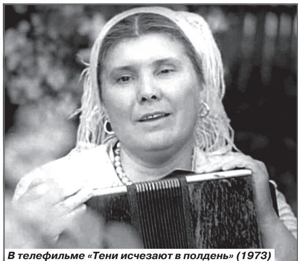
В телефильме «Тени исчезают в полдень» (1973)