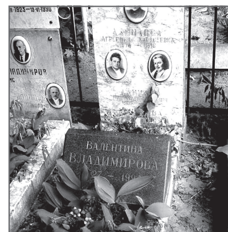
Могила Валентины Владимировой на Ваганьковском кладбище

Заслуженную артистку РСФСР похоронили рядом с мужем на Ваганьковском кладбище. Ей, как и супругу, на момент смерти было 66 лет.