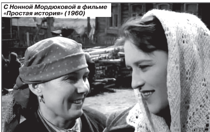
С Нонной Мордюковой в фильме «Простая история» (1960)