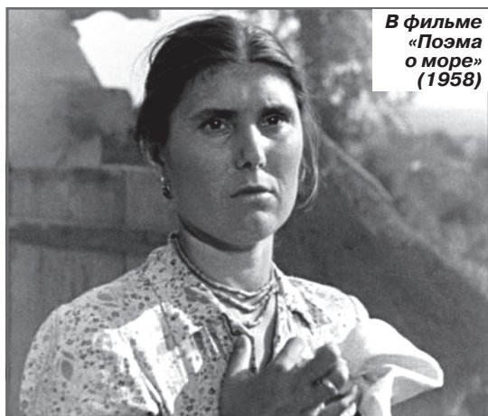
В фильме «Поэма о море» (1958)