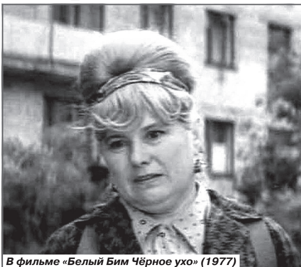
В фильме «Белый Бим Черное ухо» (1977)