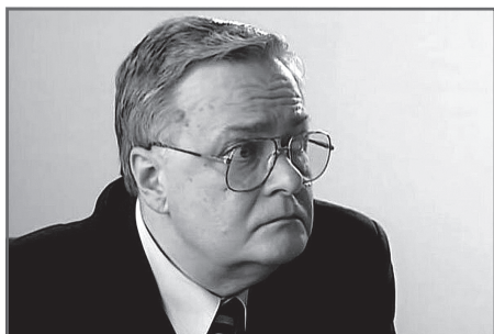
В сериале «Марш Турецкого» (2000)