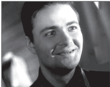
В фильме «Нет неизвестных солдат» (1965)