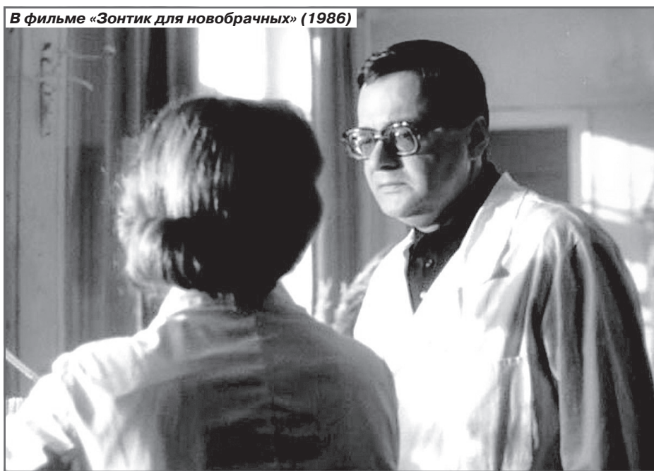
В фильме «Зонтик для новобрачных» (1986)