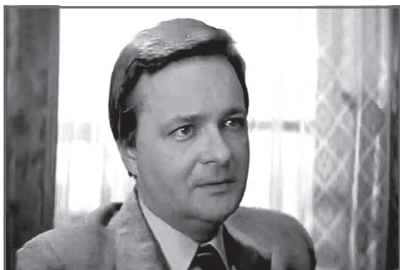
В фильме «Пять минут страха» (1985)

Вячеслав Иванович Езепов ушел из жизни 9 декабря 2020 года от коронавируса. Ему было 79 лет.