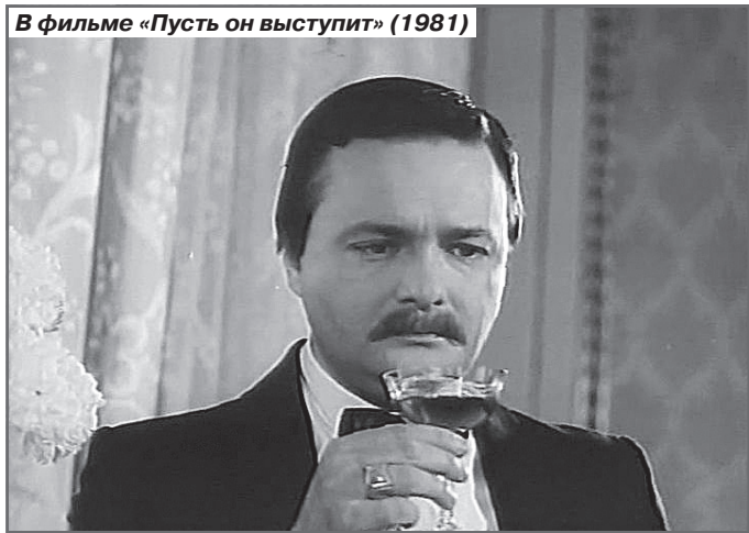
В фильме «Пусть он выступит» (1981)