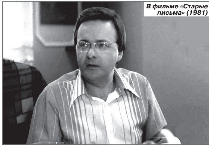
В фильме «Старые письма» (1981)