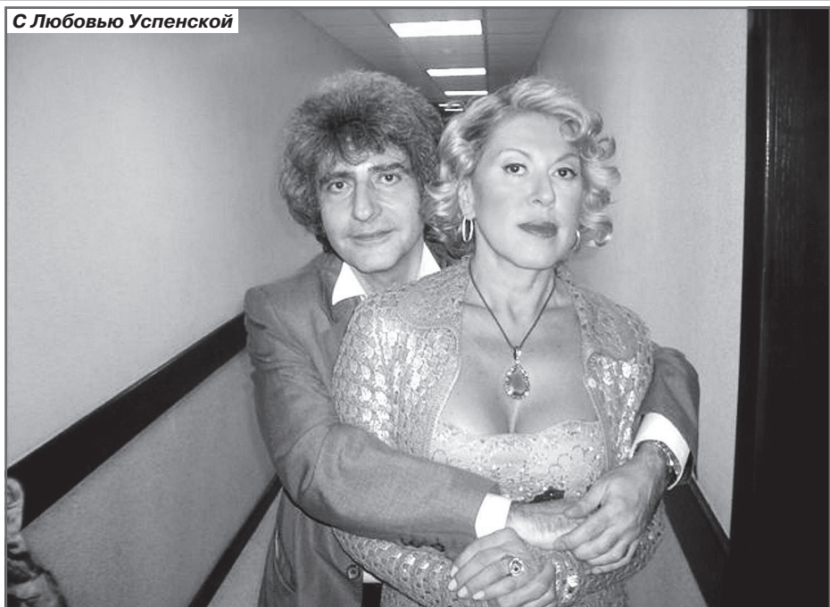
С Любовью Успенской

- Нет. Они на фронте встретились. Мама была военный врач, папа - политрук. И, в общем, поэтов в нашей семье не было.