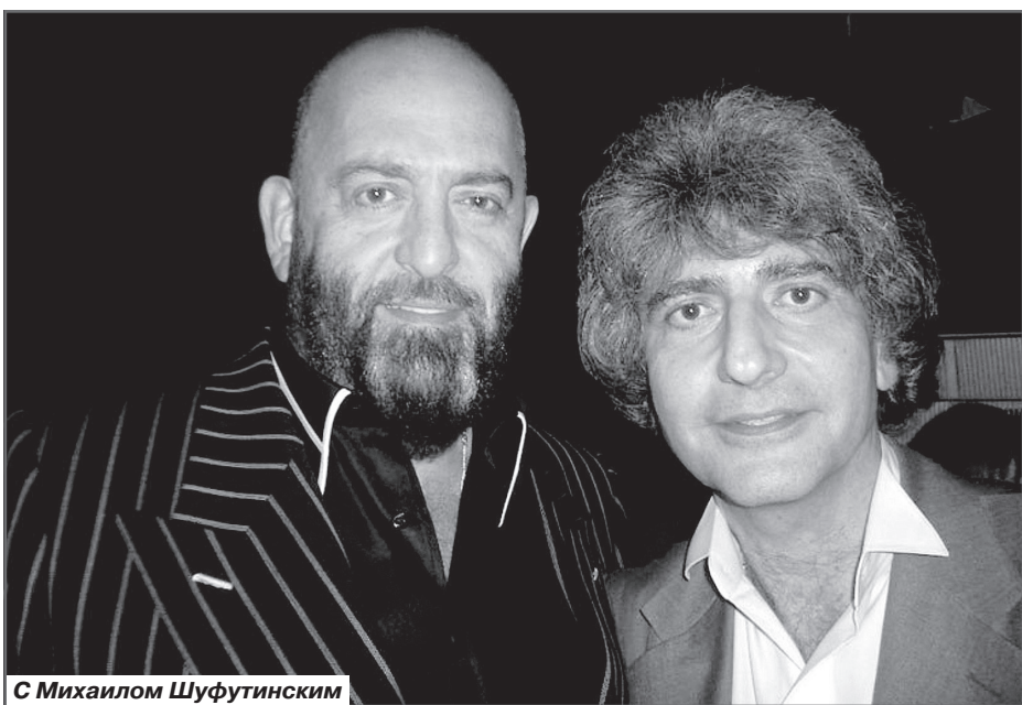
С Михаилом Шуфутинским