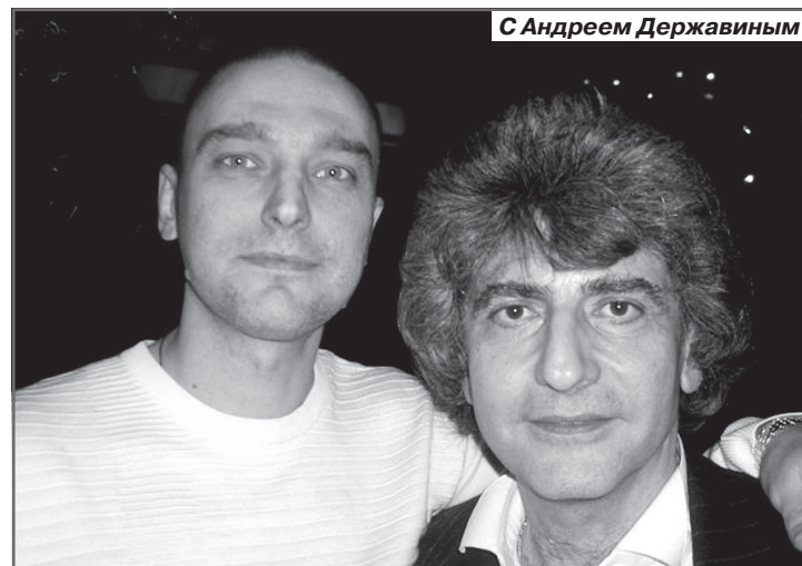
С Андреем Державиным