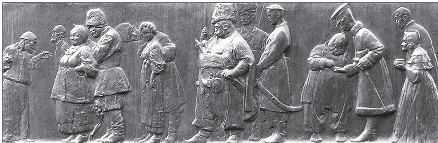
Гиляровский послужил прообразом Тараса Бульбы (в центре) для барельефа на пьедестале памятника Гоголю в Москве (скульптор Н.Андреев)

полковых офицеров. Лишь в 1886 году их статус был узаконен соответствующим приказом военного ведомства.