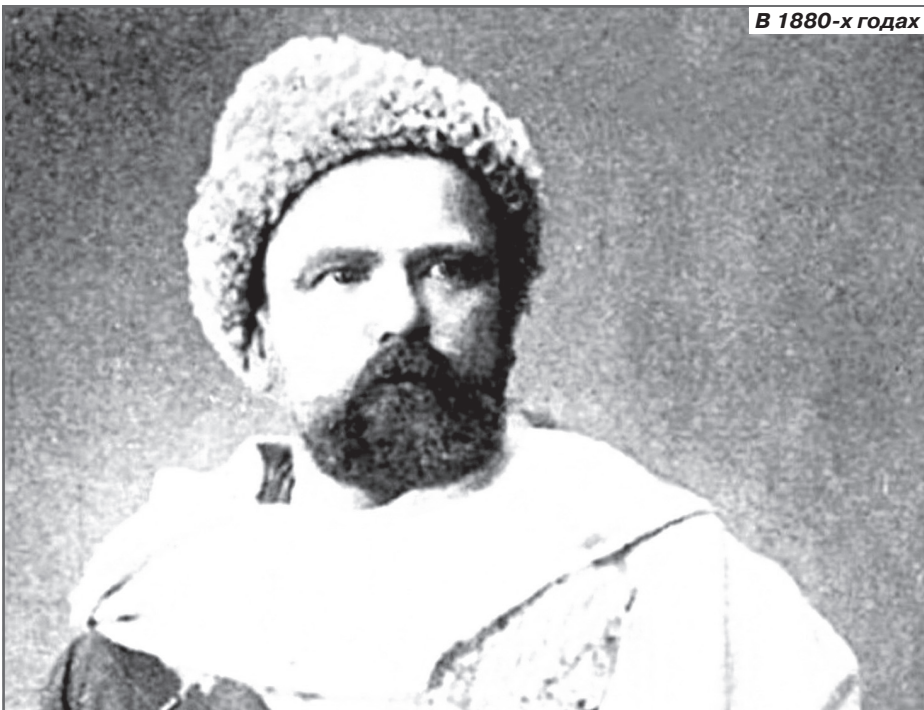
В 1880-х годах