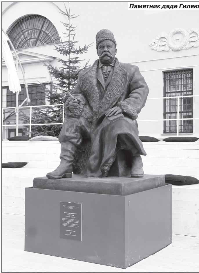
Памятник дяде Гиляю

В своих очерках Гиляровский вспоминает и о многих встречавшихся ему на пути писателя, поэтах, актерах, художниках и прочих интересных личностях. Интересны описания быта обычных московских людей - булочников и парикмахеров, официантов и извозчиков, студентов и начинающих художников. Замечательны описания московских трактиров и ресторанов, бань и скверов.