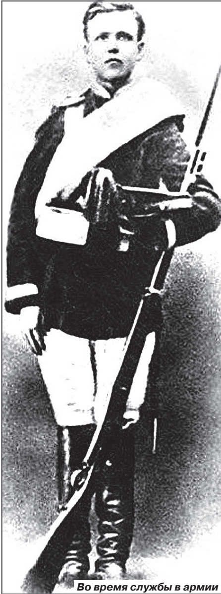
Во время службы в армии