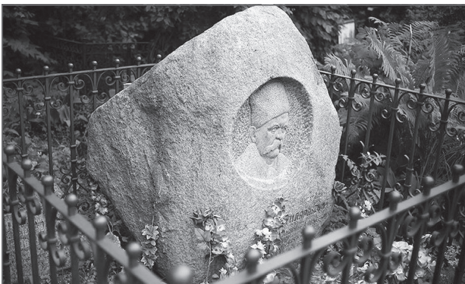
Памятник на могиле Владимира Гиляровского на Новодевичьем кладбище

ональный игрок в бильярд по прозвищу «Капитан», с травмированной рукой проигравший партии. Все эти люди - жертвы социального бесправия, нищеты, многочисленных пороков.