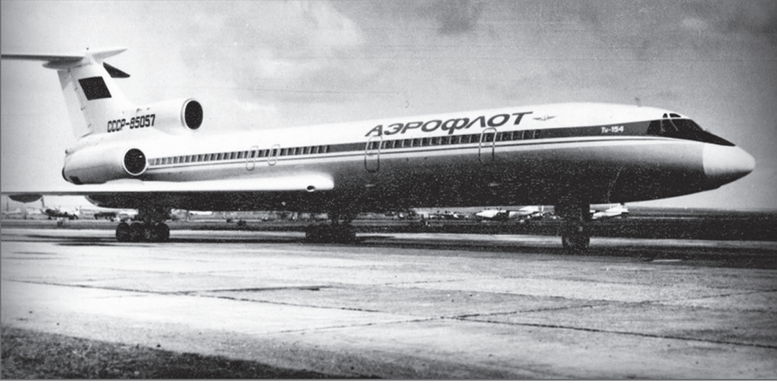
Самолет аналогичный потерпевшему крушение