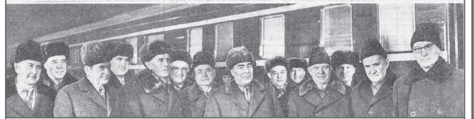
Про отъезд Л. Брежнева в Прагу на 1-й полосе. Про погибших и раненых советских граждан ни слова соболезнования. Газета «Правда» 1973 №55