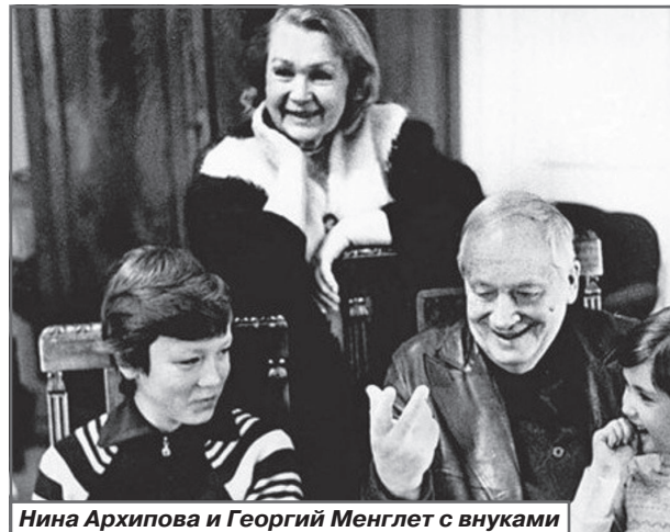
Нина Архипова и Георгий Менглет с внуками