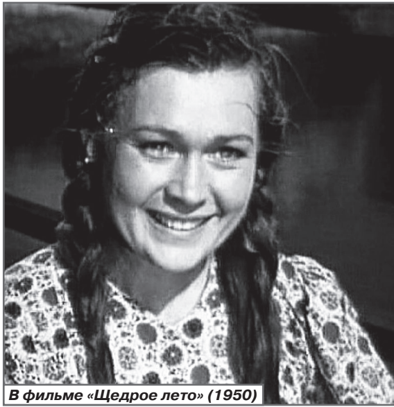
В фильме «Щедрое лето» (1950)