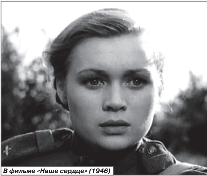
В фильме «Наше сердце» (1946)