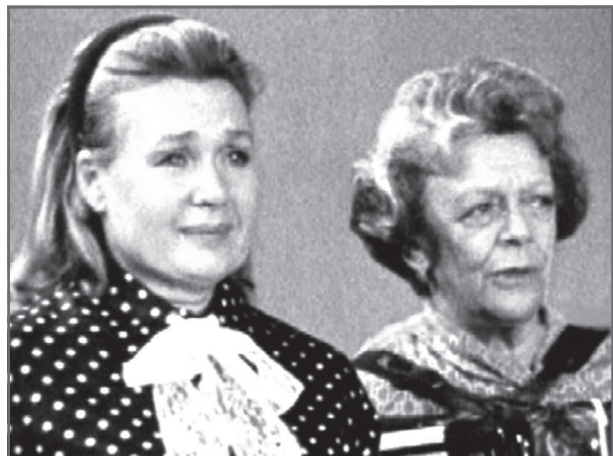
С Татьяной Пельтцер в спектакле «Проснись и пой!»