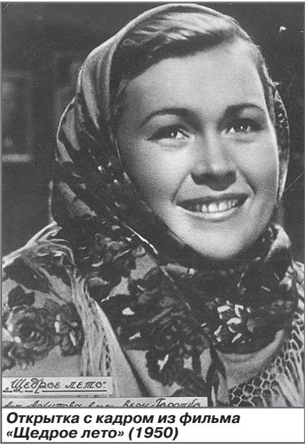
Открытка с кадром из фильма «Щедрое лето» (1950)

добрых женщин, однако ей удавалось играть совершенно разных по характеру персонажей.